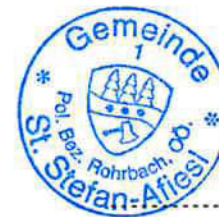
Der Bürgermeister Alfred Mayr